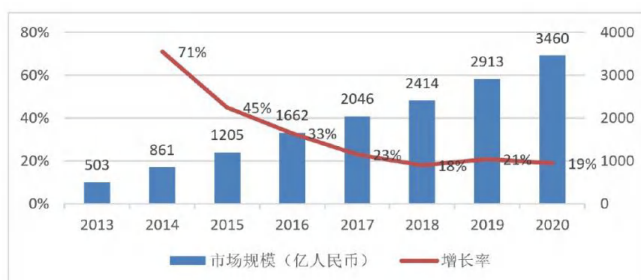
图1 中国在线订餐市场规模

集团多元化发展的重要举措。同时，饿了么自身拥有的庞大用户数据也可以实现与阿里集团技术的互补，实现双赢。此外，阿里巴巴收购饿了么的最大原因是外卖市场份额的扩大。饿了么在外卖市场中拥有较高的品牌影响力和市场份额，同时外卖市场的受众规模还呈现出逐年增长的趋势，从图1中国在线订餐的市场规模看，从2013年起，中国的外卖市场规模持续扩大；2017—2020年，外卖市场的增长率仍保持在20%上下；到2020年，外卖市场规模已超3000亿元。同时图2中，在线订餐的市场用户规模也呈正相关，2017—2020年的增长率保持在18%左右，并在2020年用户规模达到4.8亿人。